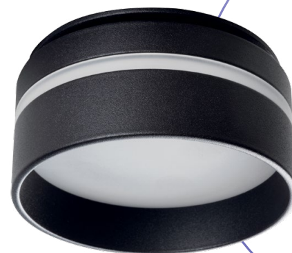
GOVIK-ST DSO-B (29237)

Uniwersalny wzór w dwóch kolorach, białym i czarnym matowym.