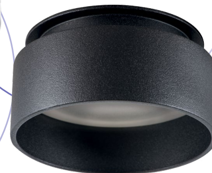
GOVIK DSO-B (29236)