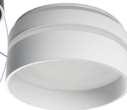
GOVIK-ST DSO-W (29238)