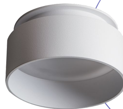
GOVIK DSO-W (29235)

Uniwersalny wzór w dwóch kolorach, białym i czarnym matowym.