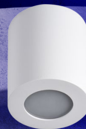
SANI IP44 DSO-W

Rodzina składa się z opraw w 3 kolorach: biały, czarny i satynowy nikiel .