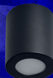
SANI IP44 DSO-B