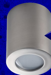
SANI IP44 DSO-SN