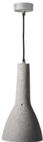
ETISSA D20 GR