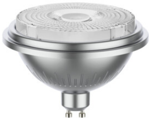
IQ-LED ES-111 12W