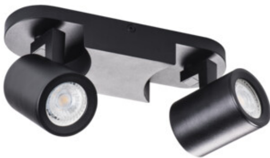
LAURIN EL-2I B