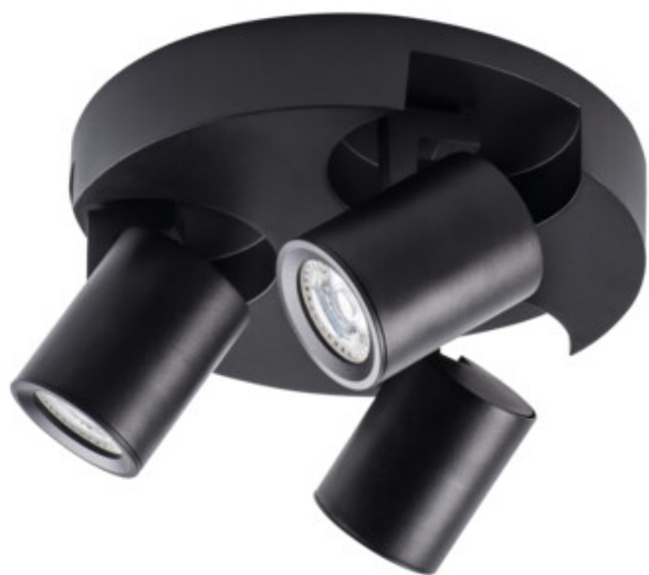
LAURIN EL-30 B