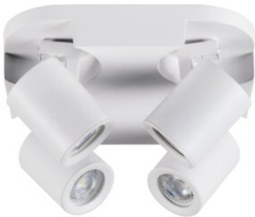
LAURIN EL-40 W