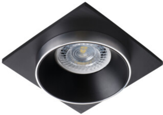
SIMEN DSL SR/B/B