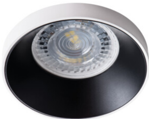
SIMEN DSO W/B