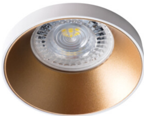
SIMEN DSO W/G