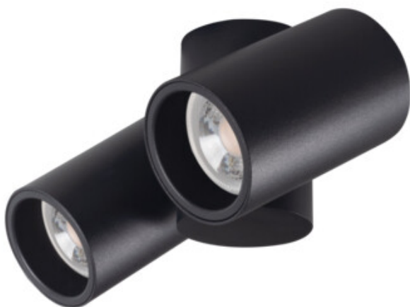
BLURRO 2xGU10 CO-B