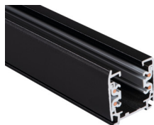
33232 TEAR N TR 2M-W