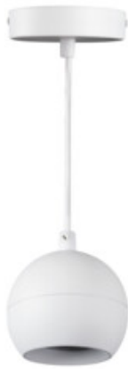
GALOBA C 1xGU10 W